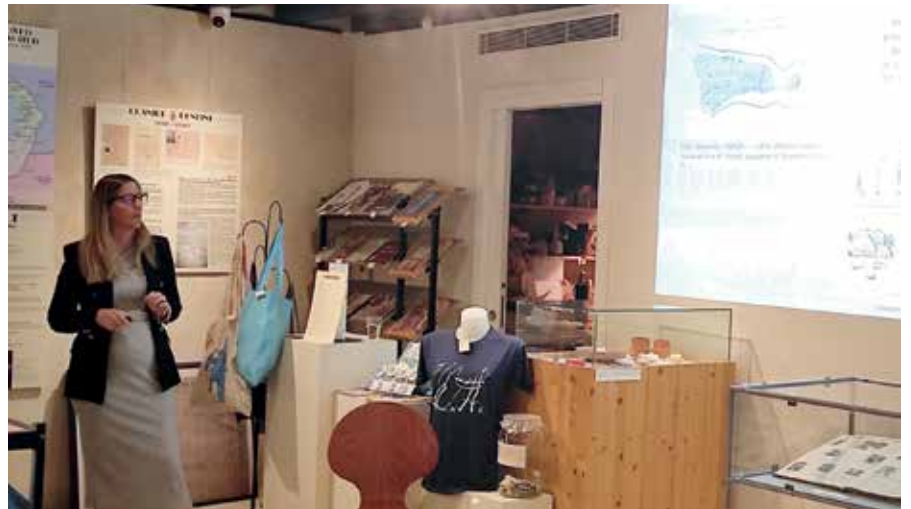
Ciklus predavanja - Ciclo di conferenze: Cosa xe de novo?, 23.10.2025.